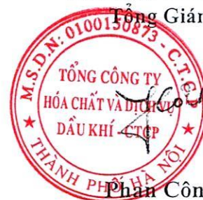
Phan Công Thành