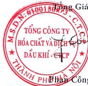
Đàn Công Thành